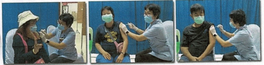
บุคคลที่มีโรคประจำตัวเรื้อรัง